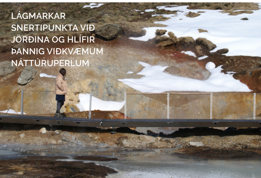
LÁGMARKAR SNERTIPUNKTA VIÐ JÖRÐINA OG HLÍFIR ÞANNIG VIÐKVÆMUM NÁTTÚRUPERLUM