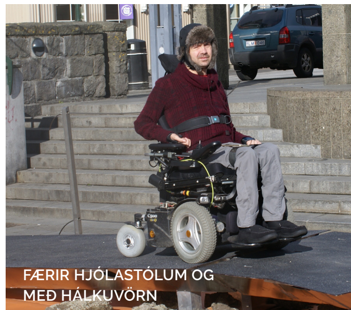
FÆRIR HJÓLASTÓLUM OG MEÐ HÁLKUVÖRN